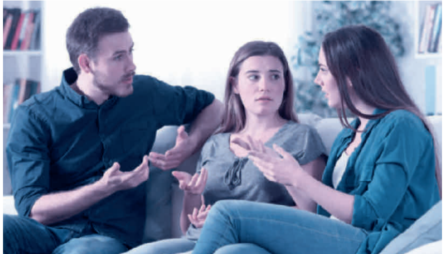
Kommt es zum Streit zwischen den Erben, muss der Willensvollstrecker schlichten.

Der Willensvollstrecker setzt den letzten Willen des Erblassers um. Dafür stellt er als Erstes ein Inventar auf, das er laufend nachführt. Er verwaltet die Erbschaft bis zur Teilung und muss darauf achten, dass das Vermögen erhalten bleibt. Er bezahlt die Schulden des Erblassers inklusive der Todesfallkosten und treibt offene Forderungen ein. Zur Verwaltung gehören auch die laufenden Geschäfte, beispielsweise muss er sich um den Unterhalt von Liegenschaften kümmern, laufende Verträge kündigen oder allenfalls die Liquidation einer Einzelunternehmung umsetzen. Er ist verantwortlich für die Erstellung der